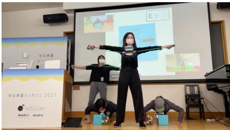
ハーモニーフラッグ演奏の様子

11 月 17 日（日）15:10～15:40 にステージで行う「ゆる楽器パフォーマンス」では、体験会で練習した曲を発表します。ぜひステージでの演奏にもご参加ください。